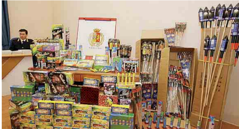
La polizia stradale di Arezzo ha fermato due modenesi che nascondono in auto oltre cento chilogrammi di botti illegali.

La polizia ha effettuato perquisizioni nelle loro abitazioni alla ricerca di altri eventuali quantitativi di botti illegali. (r. i.)